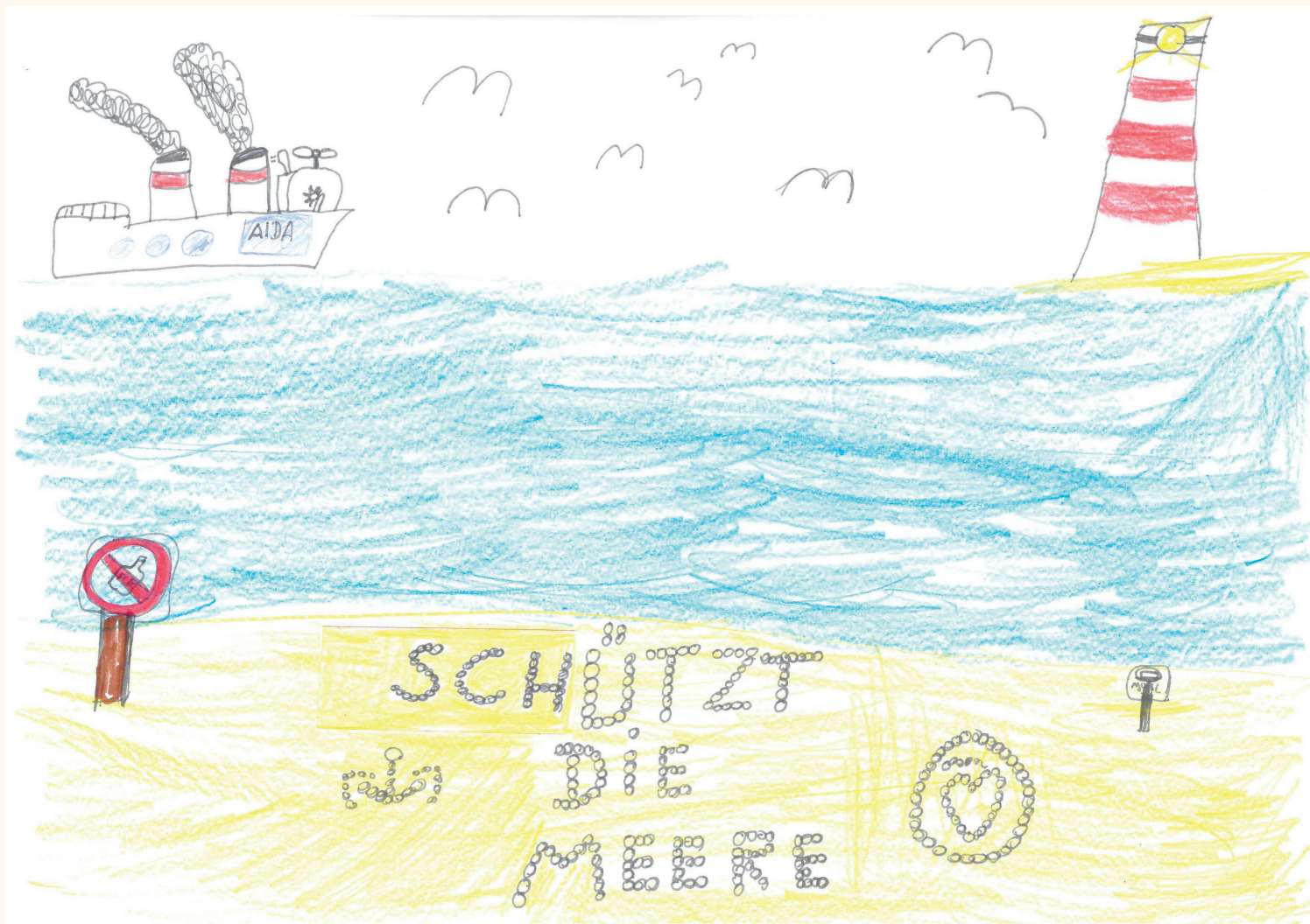
"Schützt die Meere"