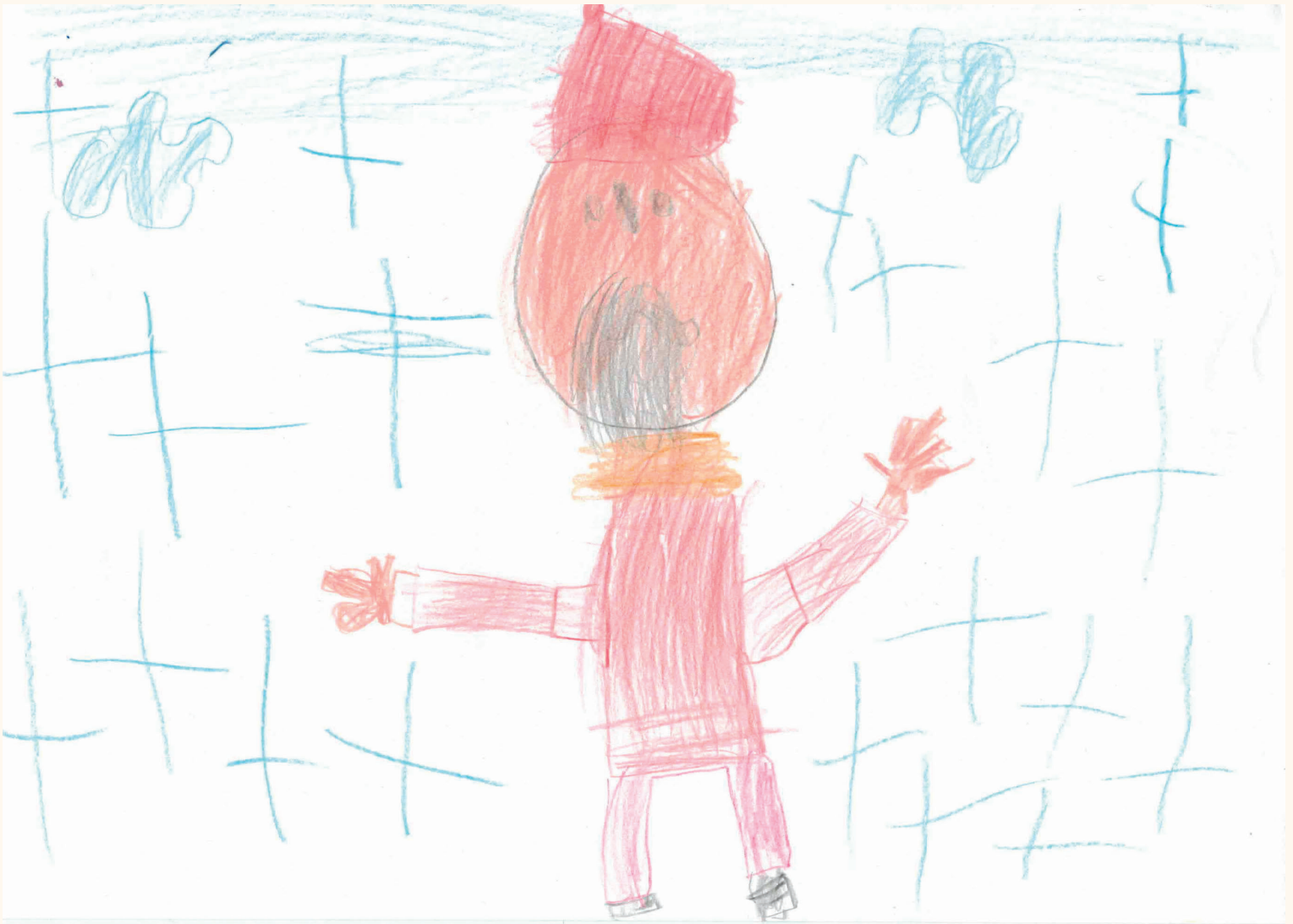
"Bald schon kommt der Weihnachtsmann"