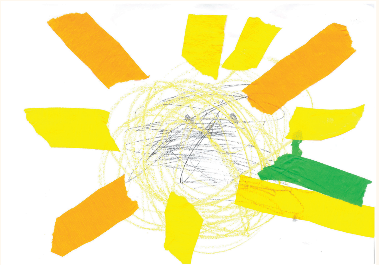
"Sonne, liebe Sonne"