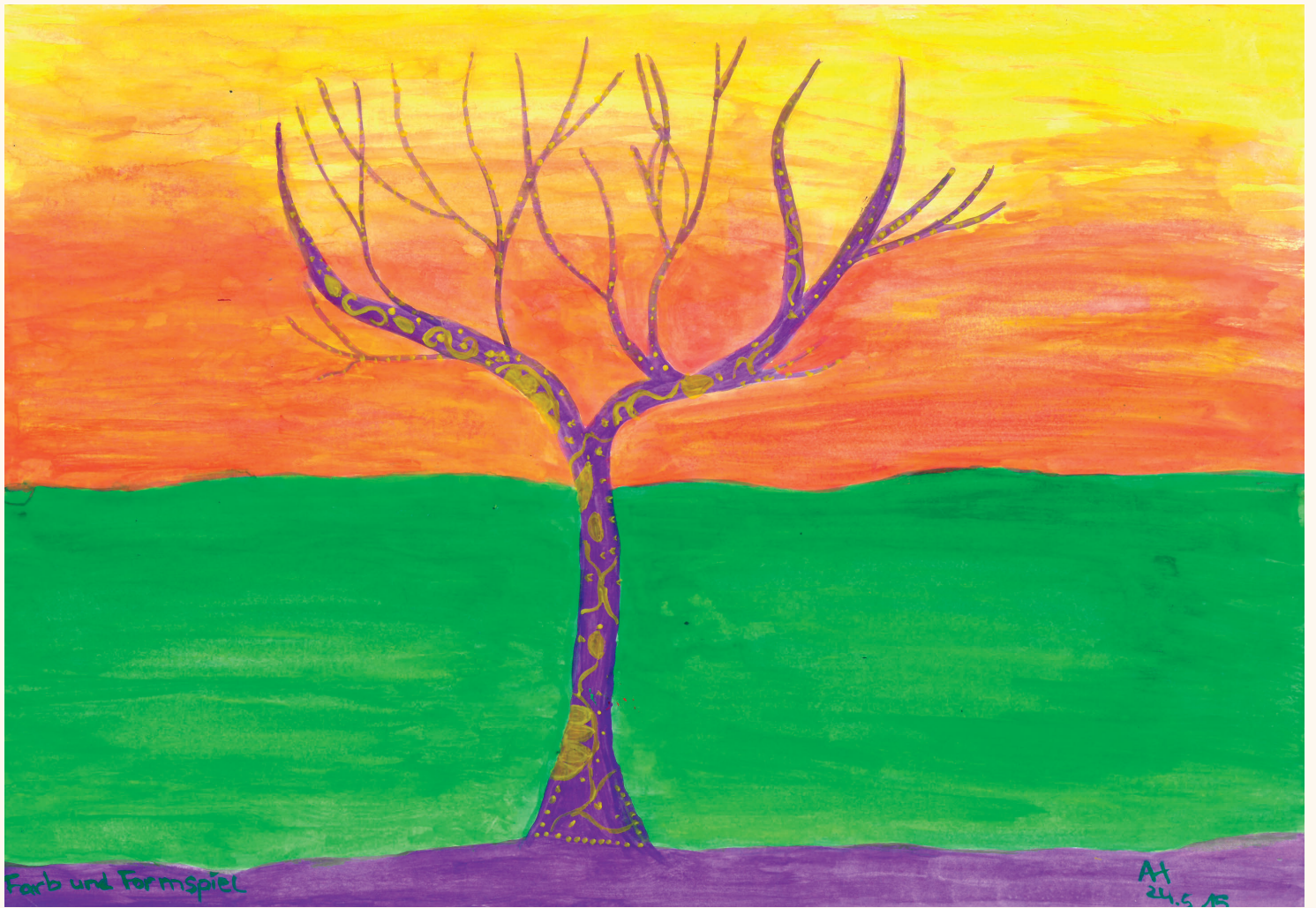
"Farb- und Formspiel"