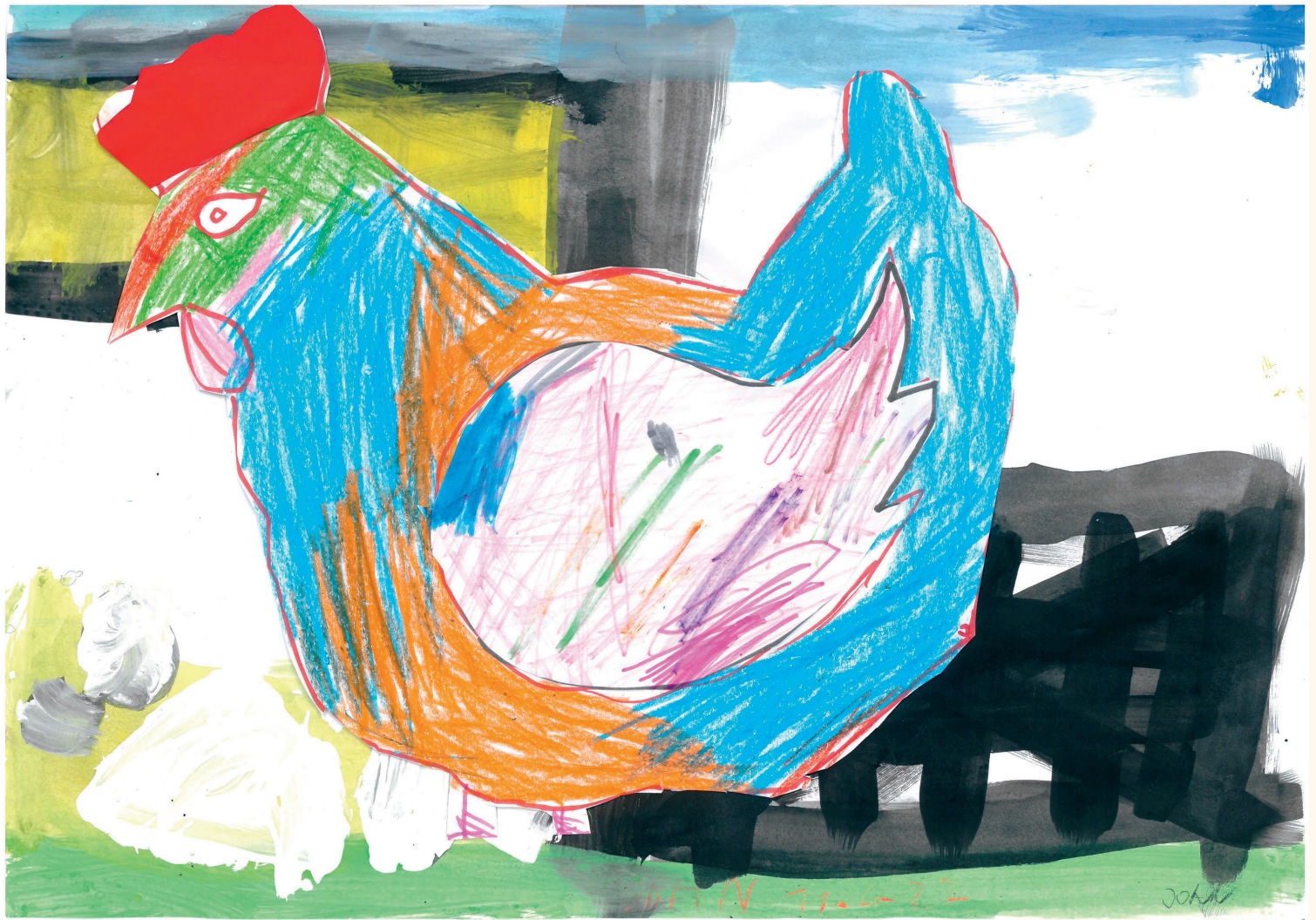
"Unser neues Huhn"