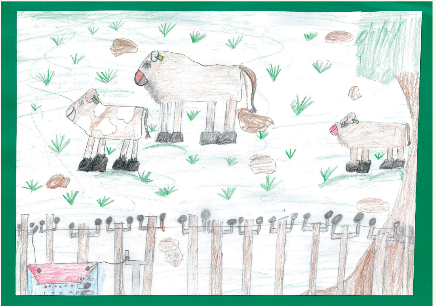
"Kühe in Steinbach"