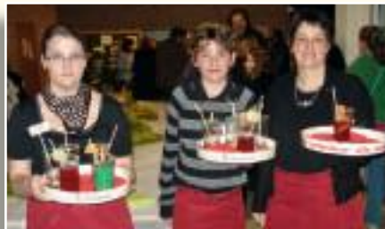
Ein schön präsentierter Cocktail schmeckt doppelt gut.

Eltern stellten ihre männer- bzw. frauenuntypischen Berufe vor. Es gelang eine Kooperation mit Handwerkern, so dass diese ihre Berufe in der