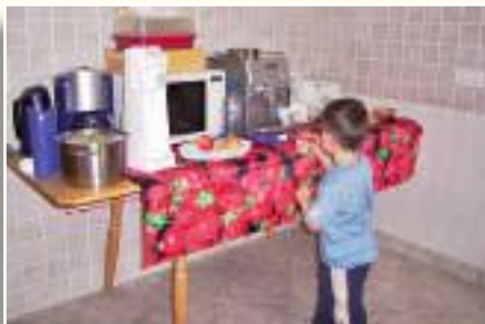
Unsere kleine Notküche.

Die Küche war zu klein, wenn wir gemeinsam kochen wollten. Immer wieder gab es Rangeleien beim morgendlichen Schuhanziehen.