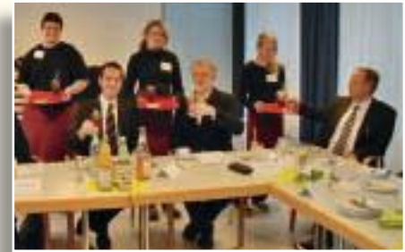
Professionelle Bewirtung der Bürgermeister.

8. Klasse präsentieren. Ein Schreiner baut mit den SchülerInnen ein Spielhaus, in Neuenstein wurde eine »Firmenlandkarte« mit den örtlichen Ausbildungsmöglichkeiten erstellt.