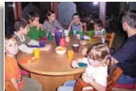
Vorübergehend essen wir im Wintergarten.