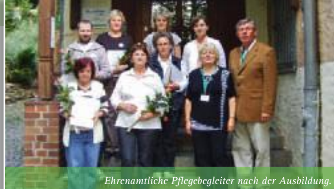
Ehrenamtliche Pflegebegleiter nach der Ausbildung.

In 60 Unterrichtsstunden vermittelten Dozenten aus dem Pflegenetzwerk der Region Grundkenntnisse in der Pflege, im Umgang mit demenziellen und psychiatrischen Erkrankungen, sowie zu Möglichkeiten der Unterstützung. Auch Fragen zu Testament und Vollmachten standen auf dem Stundenplan.