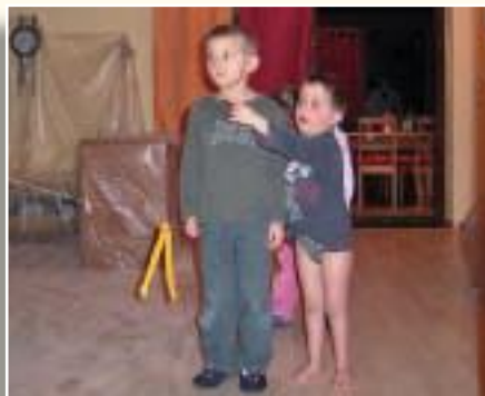
Guck mal, schon wieder was Neues.

Da wir uns gut eingelebt hatten und wohl fühlten, war es unser großer Wunsch, hier wohnen zu bleiben. Erste Gedanken zur räumlichen Erweiterung entstanden.