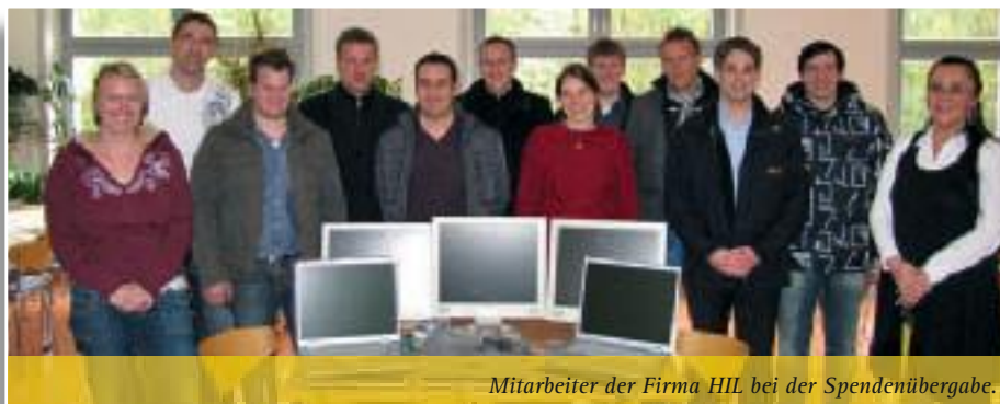
Mitarbeiter der Firma HIL bei der Spendenübergabe.

Für unsere Kinder und Jugendlichen steht nach einem Jahr ehrenamtlichem Engagement schon jetzt fest: Einen besseren Patenbetrieb hätten wir uns nicht wünschen können.