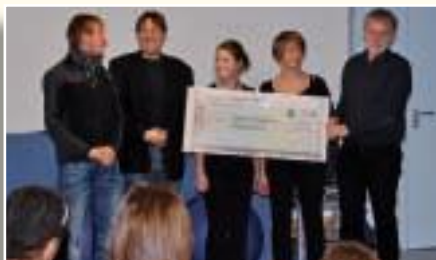
Diese großzügige Spende wird für die Zirkuspädagogik im Kinderdorf eingesetzt.