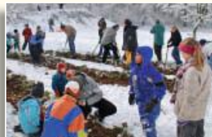
Mit vereinten Kräften werden die 5000 Zwiebeln eingepflanzt.

»Baumdoktor« Neidlein stellte in einem Vortrag die Welt der Blumenzwiebeln und Bäume vor. Die Gruppeneinteilung erfolgte bei frischen Brezeln aus der »clubeigenen« Bäckerei Mildenerger. Dann wurde es ernst. Die Gruppen »Obstbaumschnitt«, »Staudenpflege« und »Blumenzwiebel« konnten in der sonnigen Winterlandschaft ans Werk gehen. Fachkundig zeigte Herr Lütticke den richtigen Schnitt an den Obstbäumen. Parallel wurde begonnen, die vom Präsidenten gestifteten 5000 Blumenzwiebeln zu pflanzen. Unter fachkundiger Anleitung wurden Grasnarben entfernt, die Erde gelockert und aufgehoben. Daraufhin ergoss sich ein Meer von Blumenzwiebeln in die Bette. Jede Zwiebel wurde liebevoll in